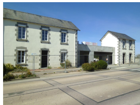
Petit à petit, la salle Maxime Tricoire dévoile ses nouveaux contours.

cantine de l'Ouvroir par une cloison pour permettre à la société Ô Fins Gourmets de disposer d'une salle de restaurant pouvant accueillir une trentaine de personnes. De plus, une porte a été ouverte entre la cuisine et la salle. L'aménagement et la décoration intérieure de cette salle ont été confiés à Pierre et Mélanie, les gérants, qui vous accueillent depuis début octobre. Rens : 05 49 80 96 47.