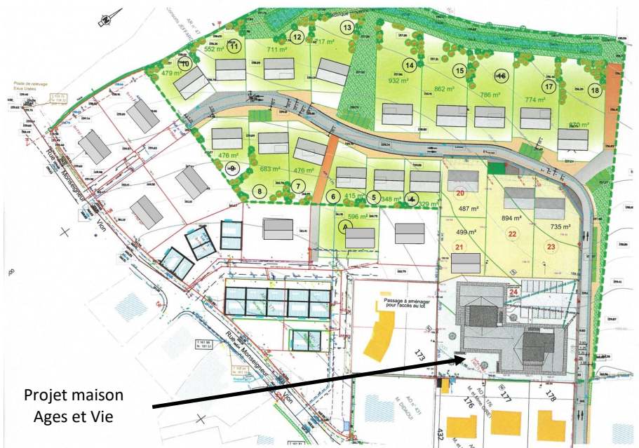
Projet maison Ages et Vie

➤ Rue de l'église (LF) : l'entreprise Eiffage, pour le compte de l'Agglo2b, a commencé les travaux de réfection des réseaux d'eaux usées et d'eaux pluviales début mai. Des gênes vont sûrement être occasionnées pour les riverains, mais tout a été mis en œuvre entre la municipalité et l'Agglo2b pour les limiter au maximum. La déviation mise en place par la rue du Dr Goupille semble donner satisfaction, même si des incivilités y sont observées.