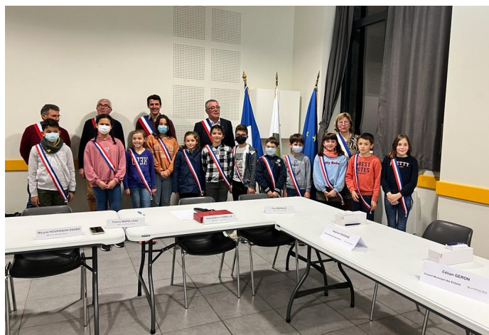
Le Conseil Municipal des Enfants a été installé et accueilli par le Conseil municipal