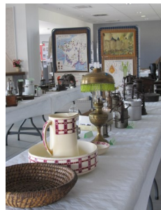
Expo JEP 2020 à La Ronde

Les Journées du Petit Patrimoine et des Moulins se déroulant normalement en juin sont, pour cette année, très compromises. Nous n'avons toujours reçu aucune information officielle. Vu le peu de temps que nous aurons pour préparer une manifestation, nous ne prévoyons pas d'animations pour juin 2021. En souhaitant des jours meilleurs pour les JEP de septembre 2021.